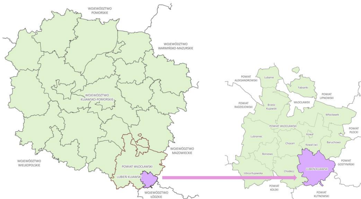
Rysunek 1. Położenie administracyjne Gminy.

Gmina odznacza się czytelną hierarchią sieci osadniczej, z miastem Lubień Kujawski jako głównym ośrodkiem obsługi mieszkańców. Jest bardzo dobrze zlokalizowana pod względem dostępności transportowej – przez teren Gminy przebiega droga krajowa DK91 oraz autostrada A1 wraz z węzłem autostradowym położonym w sąsiedniej Gminie Kowal.