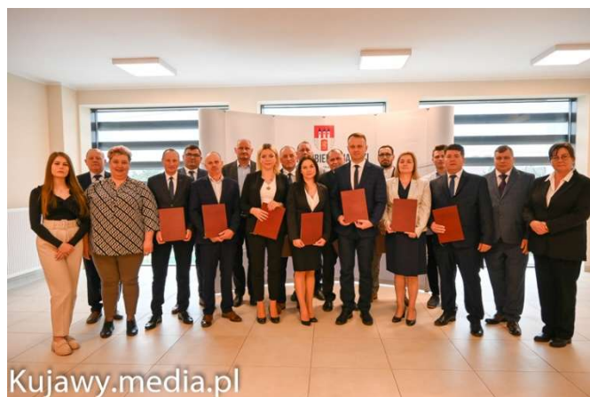
Rada Miejska w Lubieniu Kujawskim kadencji 2024 – 2029

Rada Miejska w Lubieniu Kujawskim powołała następujące komisje stałe: komisja rewizyjna, komisja skarg, wniosków i petycji, komisja budżetowo – gospodarcza, komisja rolnictwa i ochrony środowiska, komisja oświaty, kultury i sportu, komisja zdrowia i spraw socjalnych oraz komisja bezpieczeństwa i porządku publicznego.