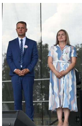
Burmistrz Lubienia Kujawskiego z Przewodniczącą Rady Miejskiej w Lubieniu Kujawskim

Rada Miejska w Lubieniu Kujawskim powołała następujące komisje stałe: komisja rewizyjna, komisja skarg, wniosków i petycji, komisja budżetowo – gospodarcza, komisja rolnictwa i ochrony środowiska, komisja oświaty, kultury i sportu, komisja zdrowia i spraw socjalnych oraz komisja bezpieczeństwa i porządku publicznego.