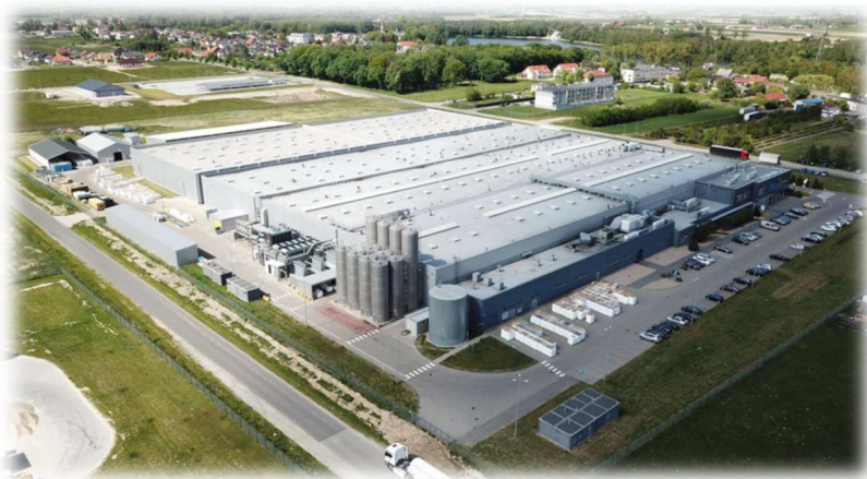
Berry Superfos Sp. z o.o.

Berry Superfos to część globalnego koncernu Berry Global, specjalizująca się w produkcji wysokiej jakości, odpornych na uszkodzenia opakowań z tworzyw sztucznych. Firma oferuje szeroki asortyment opakowań, które są projektowane z myślą o zarówno produktach spożywczych, jak i nieżywnościowych.