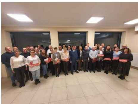
Sołtysi kadencji 2024-2029