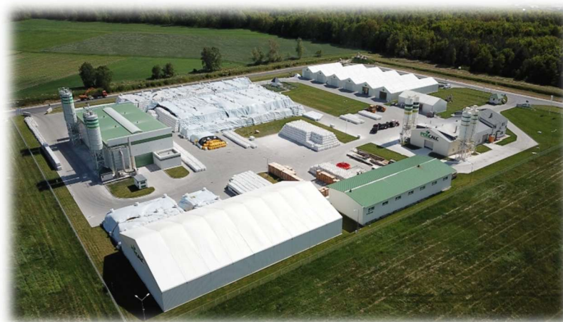
Holcim Sp. z o.o.

POLMAIS (KARBOWSKI DUKLAS Sp. j.) z siedzibą w Lubieniu Kujawskim to firma rodzinna z ponad 30-letnim doświadczeniem, specjalizująca się w kompleksowej obsłudze rolnictwa. Zajmują się głównie dystrybucją kwalifikowanego materiału siewnego (kukurydza, rzepak – autoryzowany dystrybutor KWS), nawozów, środków ochrony roślin oraz skupem zbóż.