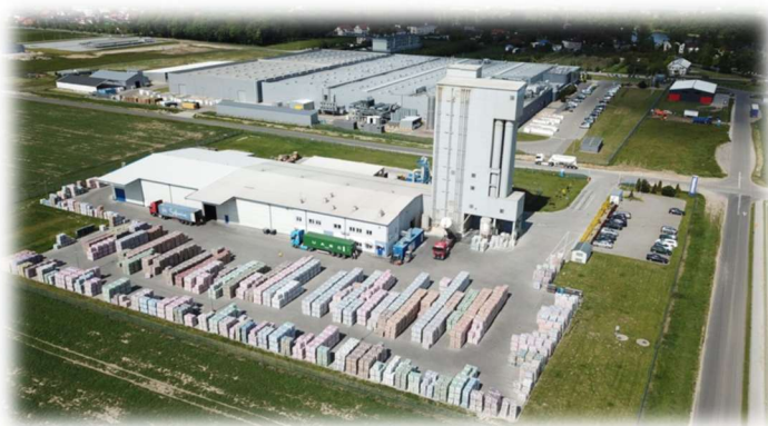
Kreisel Technika Budowlana Sp. z o.o.

Berry Superfos to część globalnego koncernu Berry Global, specjalizująca się w produkcji wysokiej jakości, odpornych na uszkodzenia opakowań z tworzyw sztucznych. Firma oferuje szeroki asortyment opakowań, które są projektowane z myślą o zarówno produktach spożywczych, jak i nieżywnościowych.