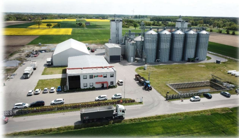
Polmais Sp. J.

POLMAIS (KARBOWSKI DUKLAS Sp. j.) z siedzibą w Lubieniu Kujawskim to firma rodzinna z ponad 30-letnim doświadczeniem, specjalizująca się w kompleksowej obsłudze rolnictwa. Zajmują się głównie dystrybucją kwalifikowanego materiału siewnego (kukurydza, rzepak – autoryzowany dystrybutor KWS), nawozów, środków ochrony roślin oraz skupem zbóż.