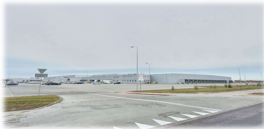
Dino Polska Centrum Dystrybucyjne Kaliska

Dino to ogólnopolska sieć oraz wiodący gracz w perspektywnym i rosnącym segmencie średniej wielkości supermarketów zlokalizowanych w pobliżu miejsc zamieszkania klientów. Dino to także jedna z najszybciej rosnących sieci, pod względem liczby sklepów i wartości sprzedaży, na całym rynku handlu detalicznego artykułami spożywczymi w Polsce.- ( https://grupadino.pl/profil-dzialalnosci/ )